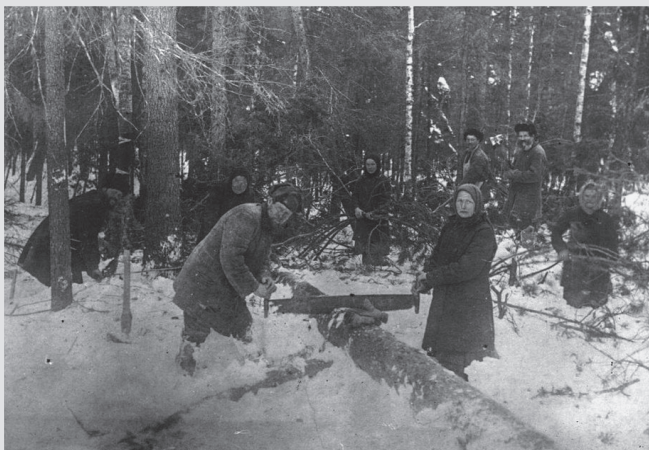
Спецпереселенцы в Сибири

Папа мог погибнуть неоднократно. Не знаю точно, в каком году, и спросить уже не у кого, но знаю, что папа был мальчишкой, когда его большую семью