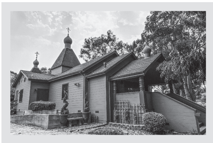
Храм преподобного Серафима Саровского в Монтерее

Первым делом хочу вспомнить своих родителей. Во-первых, в их судьбе отражается судьба миллионов русских людей. Во-вторых, именно они дали мне все. Воспитали в православной вере меня, моего