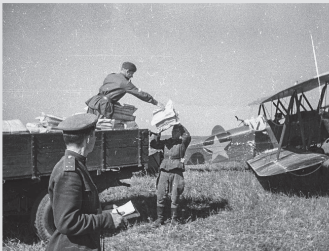
Формирование груза почтового самолета