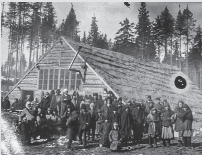
Спецпереселенцы в Сибири