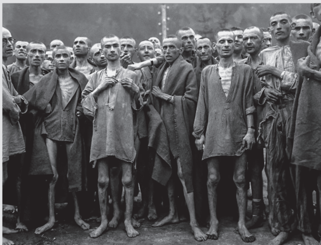
Заклученные концентрационного лагеря в Эбензее

Папа провел девять месяцев в концлагере. Сначала военнопленных держали просто в поле, обнесенном колючей проволокой. Папа как-то вспоминал, что немцы ради развлечения кидали через проволоку