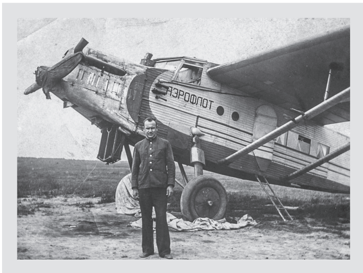
К-5 — Флагман советской авиации в тридцатые годы

Но сейчас вспоминаю: однажды он рассказал, как немцы бомбили аэродром, а он с каким-то стариком, может, сторожем, оказался в старом сарае и стрелял из винтовки в «штуку». Я не понимал тогда, что это за «штука», а сейчас знаю: это самый известный из немецких боевых самолетов люфтваффе, прозванный сокращенно «штука» — от «Штурцкампфлюгцойг», пикирующий бомбардировщик «Юнкерс Ю-87».