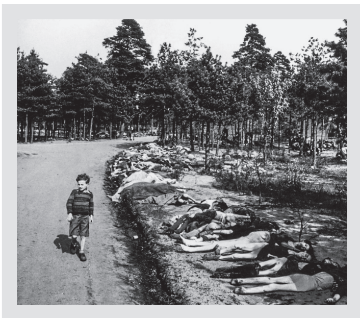
Немецкий мальчик идет по дороге, на обочине которой лежат трупы сотен заключенных, погибших в концлагере Берген-Бельзен

замерзшую свеклу, чтобы посмотреть, как умирающие от голода люди будут драться из-за пищи.