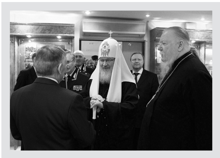
Святейший Патриарх Кирилл и протоиерей Димитрий Смирнов приняли участие в работе круглого стола Московского университета МВД России. 28 марта 2012 г.

В многообразии возложенных на него послушаний отец Димитрий неизменно стремился являть себя добрым и любящим пастырем, с дерзновением и сердечной простотой возвещающим людям евангельские истины, находящим слово ободрения и поддержки для всех его чаявших.