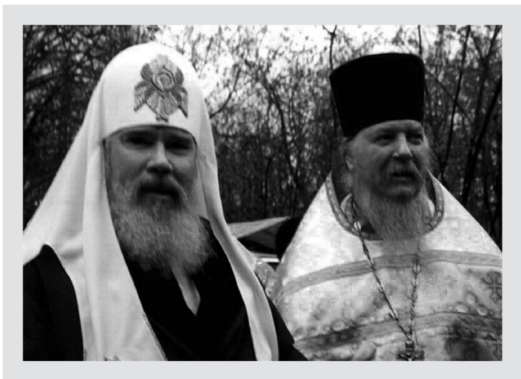
Святейший Патриарх Алексий II и протоиерей Димитрий Смирнов

и Святая Троица непосредственно участвуют в жизни нашего Патриарха.