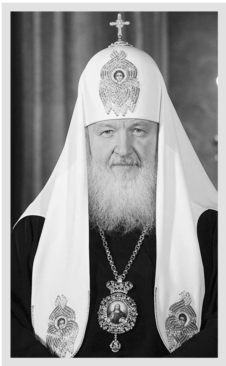
Святейший Патриарх Московский и всея Руси Кирилл