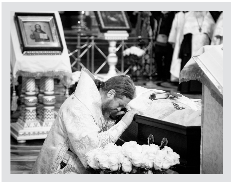
Митрополит Тихон (Шевкунов) у гроба протоиерея Дмитрия Смирнова в Храме Христа Спасителя

Но отец Дмитрий не был бы отцом Дмитрием, если бы тут же не перевел разговор на другое. Он сказал мне такие теплые, добрые слова, такие совсем-совсем родные, отеческие... Было видно, что каждое слово дается ему с большим трудом. И мы попрощались.